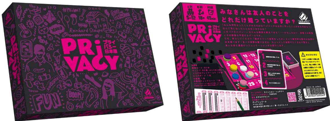
プライバシー 日本版

JR 東中野駅より徒歩1分、世界のボードゲーム1,000種類以上を取り揃えたボードゲームカフェ「DEAR SPIELE(ディアシュピール)」は2017年12月中旬、ドイツ生まれの大人気ボードゲーム「プライバシー(原題：Privacy/作者：Reinhard Staupe)」の日本版を発売いたします。